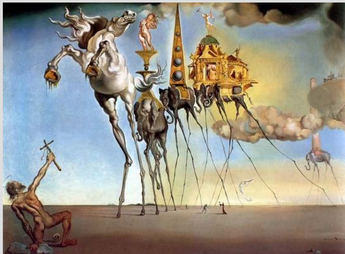
[S. Dalí – The temptation of St. Anthony, 1946]