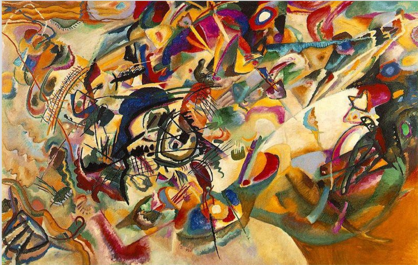
[W. Kandinsky – Composition VII, 1913]